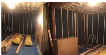
【 枠縁+減音材を施工 】