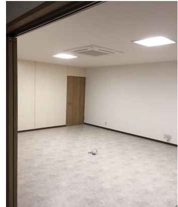
【 枠縁+減音フォーム™ を施工 】