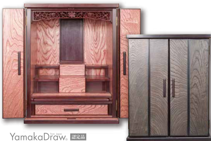
YamakaDraw new design 認定品

熟練の職人技でひとつひとつ丁寧に 伝統の「技と心」を込めて仕上げました。 純国産で天然材を使用し、 天然柾の手触り、温かみが伝わる高級家具調唐木仏壇です。 近年の住宅事情にも配慮し、 デザイン性、機能性にも優れた適度なサイズで 先祖代々受け継がれる「祈りの気持ち」を後世に伝える逸品です。