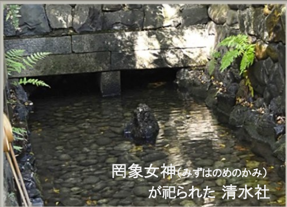
罔象女神(みずはのめのかみ)が祀られた 清水社