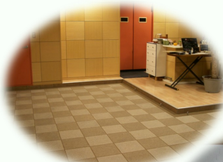
《サンド & ストーン》

色豊かなサンドで床のリニューアル演出！ 桜島火山灰を壁面に施工することで断熱効果と消臭を実現！